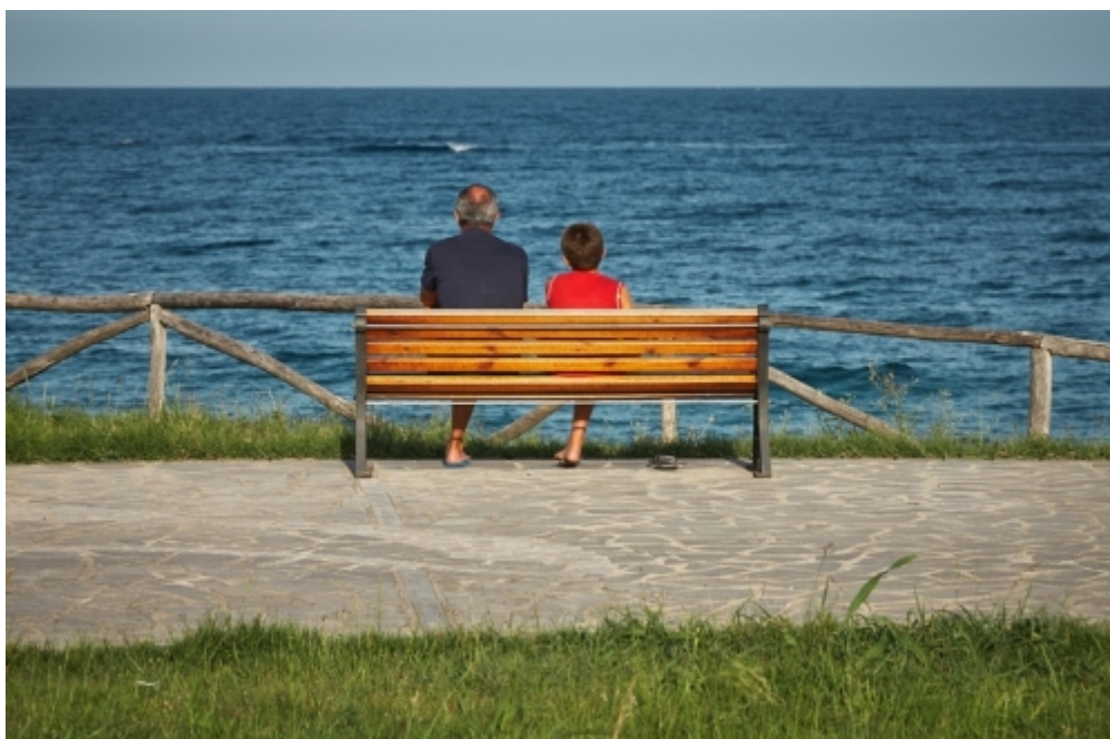
Festa dei nonni 2018: "I Senior valore insostituibile per la società"

Martedì, 02 Ottobre 2018 11:02 Scritto da Davide Lacangellera dimensione font